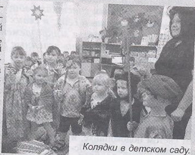
Колядки в детском саду.

Святки – это зимний народный праздник, который начинается на Рождество и длится целых две недели, до самого Крещения. В