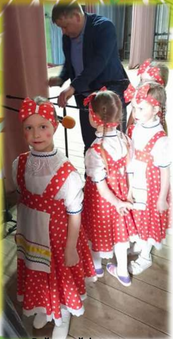
Районный фестиваль детского художественного творчества «Радуга» РДК