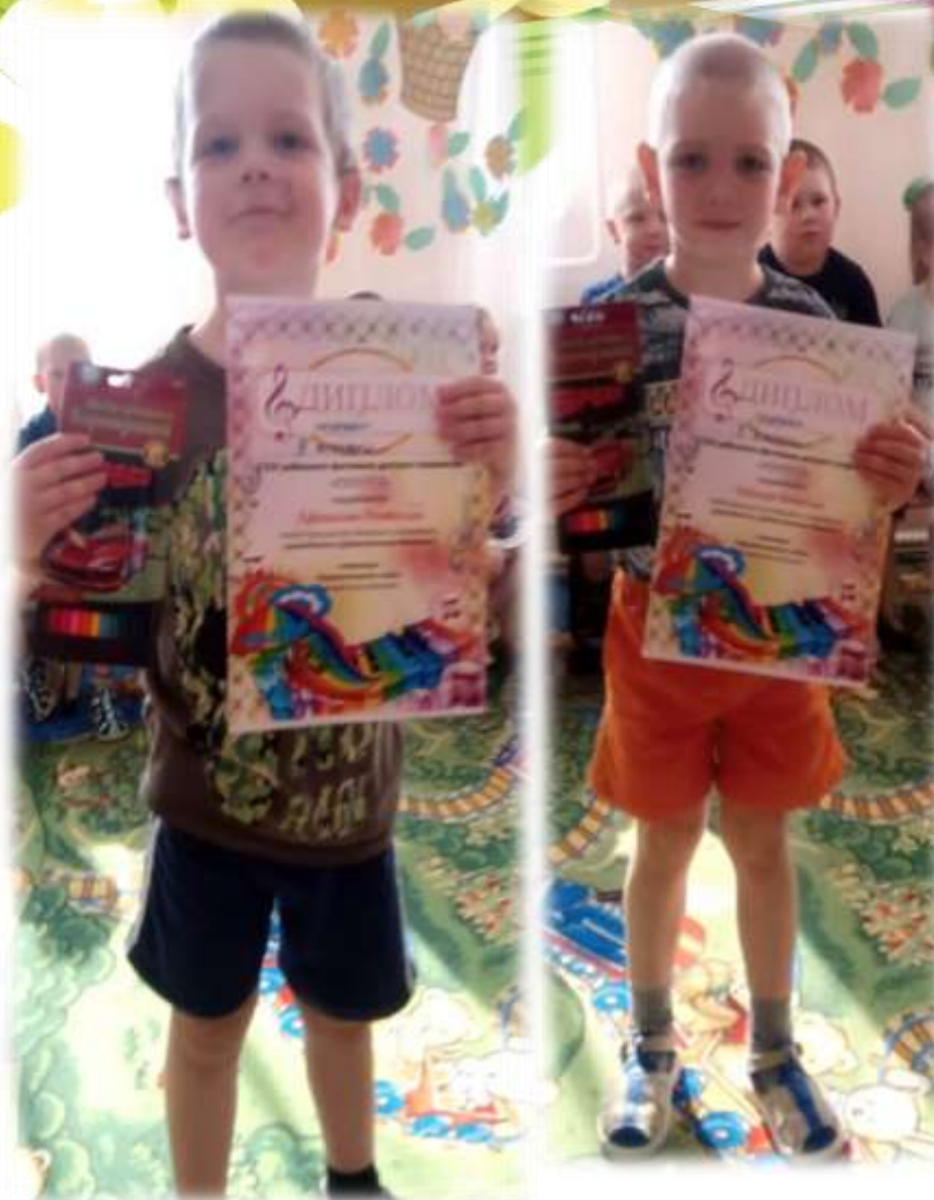
Конкурс детского творчества «Акварелька» ДШИ

Взаимодействие с Районным домом культуры и детской школой искусств позволяет нашим воспитанникам проявить свои таланты, примерить на себя роль настоящего художника, артиста и выступить с «большой» сцены!