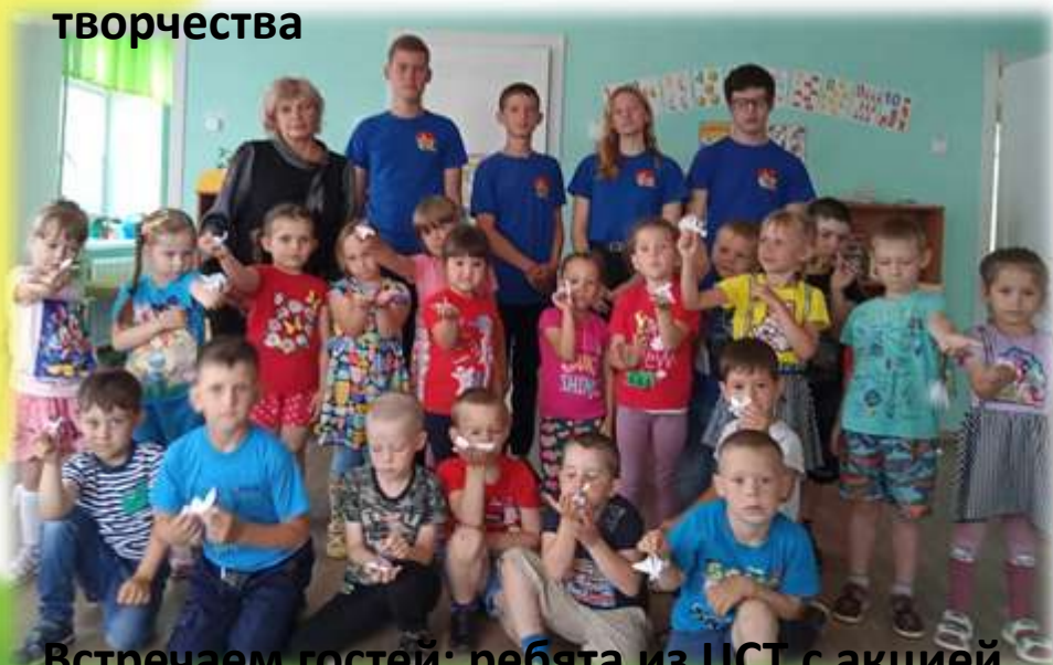
Встречаем гостей: ребята из ЦСТ с акцией «Голубь мира»