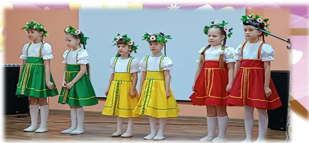
Муниципальный этап краевого конкурса «Пою мое отечество» организатор МБУДО ЦСТ