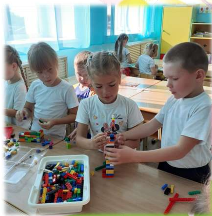
НОД по программе «Лего-моделирование»