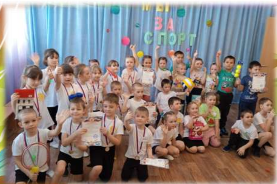
«Веселые старты -2022» совместное мероприятие с МБУДО Центр спорта и творчества