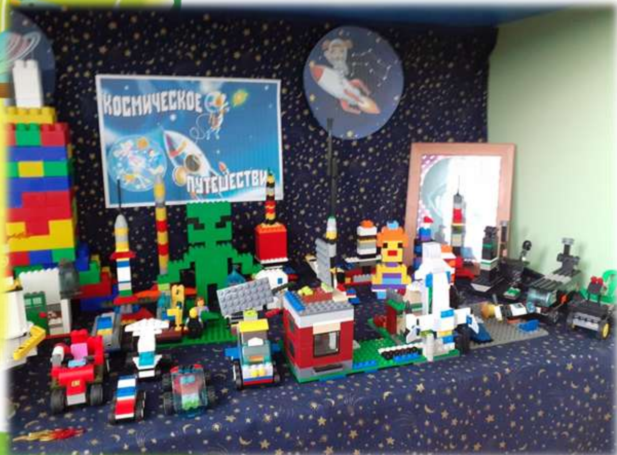
Лего-выставка в ДОУ, посвященная «Дню космонавтики»

Рабочие программы «Лего-моделирование в детском саду» и «Наураша в стране Наурандии», реализуемые в ДОУ, формируют базу первоначальных научных знаний у детей, способствуют развитию технических способностей. Программы объединяют в себе элементы игр с экспериментированием, которые активизируют мыслительно-речевую деятельность, кругозор дошкольников, развивают воображение и навыки общения, позволяют поднять на более высокий уровень развития познавательную активность дошкольников, что является одной из составляющих успешного обучения в школе.