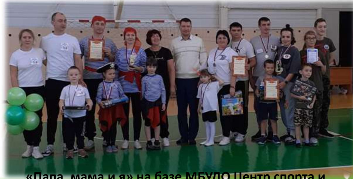
«Папа, мама и я» на базе МБУДО Центр спорта и творчества