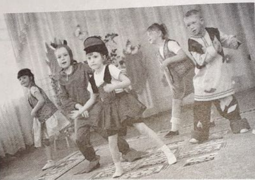
На снимках: моменты спектакля.