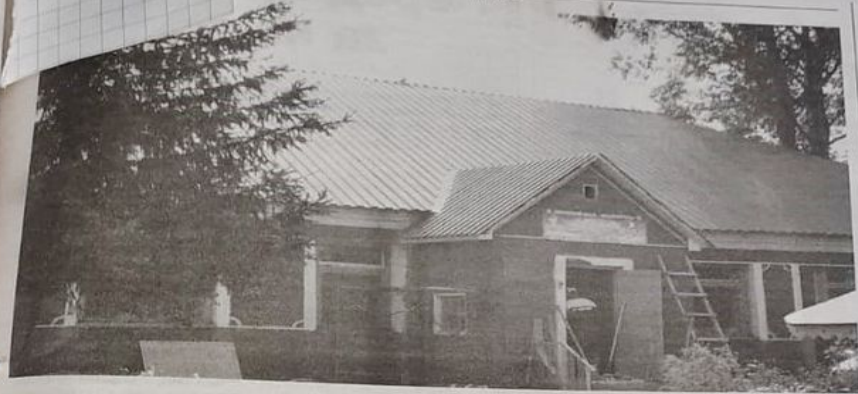
С улицы видна только новая крыша...