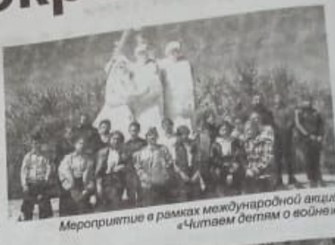
Мероприятие в рамках международной акции «Читаем детям о войне».