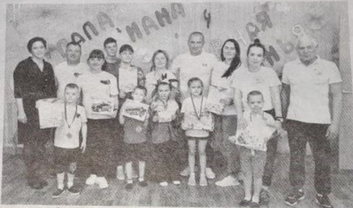
Организаторы и участники соревнований. Фото на память

Праздник прошёл в тёплой дружеской атмосфере. И,