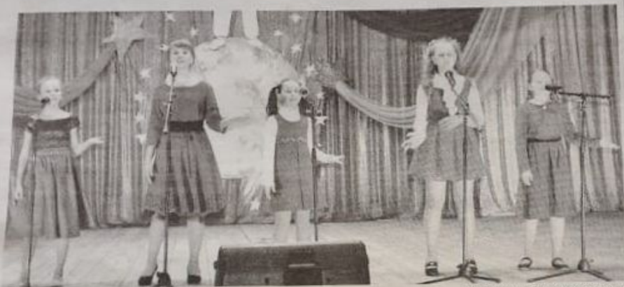
На сцене - «Звонкие голоса».

Кытманово прошел 23-й районный фестиваль детского творчества «Радуга», посвященный 60-летию первого полета человека в космос.