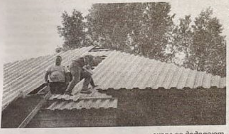
... скоро ее доделают.