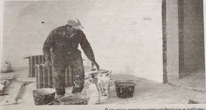
В группах во всю кипят отделочные работы.