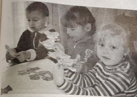
Сказку можно вырезать, рисовать и клеить!