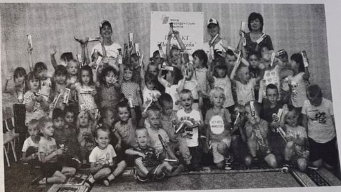
Вот такая дружная команда!